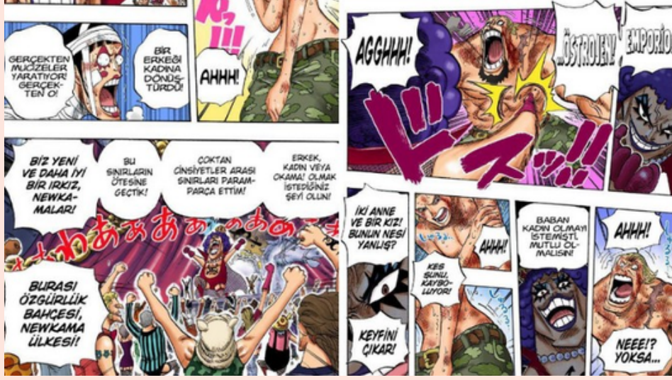
Queer teoriyi işleyen One Piece adlı mangaya ait bir görsel.

Queer teori, cinsiyetsizlik ve cinsel sınırsızlık fikrini savunan, cinsiyet rollerini reddeden ve bunun toplumsal düzeyde yaygınlaştırılmasını amaçlayan bir LGBT ideolojisi olarak biliniyor. Manga ve animelere merak salan bir çocuğun karşılaşacağı ilk eserlerden biri olan ve "shounen" türünde yer alan bu eserde, erkeklerin kadın kılığına girdiği ve karakterlerin sık sık cinsiyet değiştirdiği görülüyor.