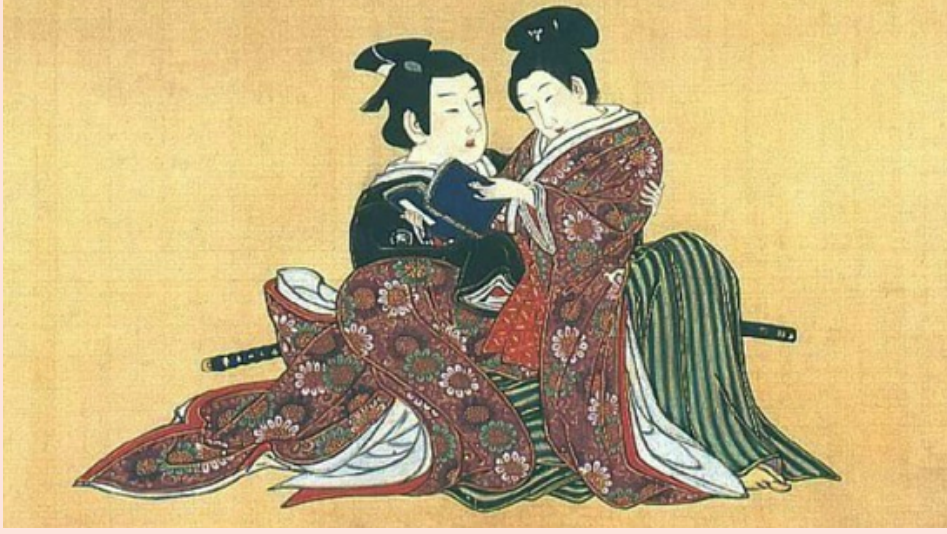
Lezbiyenliğin tasvir edildiği Shunga türünün bir örneği.

Eşcinsel ilişkiler kadar, karşı cinsiyetin kıyafetlerini giyme (cross-dressing) örnekleri de Japonya'da uzun bir geçmişe sahip. Sekizinci yüzyıla kadar uzanan yazılı kayıtlarda, erkek savaşçı kılığına giren kadınlardan bahsediliyor.