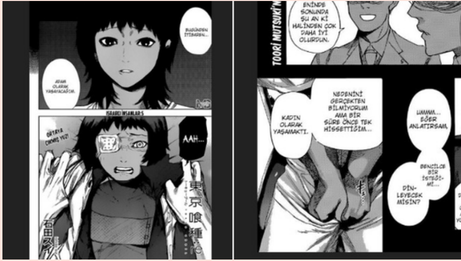
LGBT temasına yer veren Tokyo Ghoul adlı mangaya ait bir görsel.

Bu hayranlık kültürü, mangaların ve animelerin sadece birer sanat ve medya türü olarak değil, aynı zamanda bir yaşam tarzı ve kimlik oluşturma aracı olarak da algılanmasına neden oluyor.