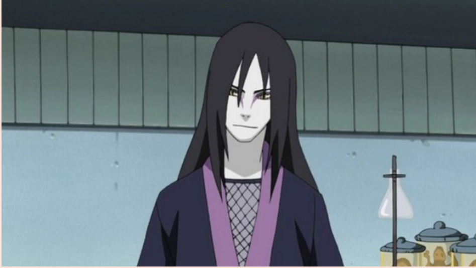
Naruto adlı mangada non-binary olarak tasvir edilen karakter.

Shounen türüne ait olan popüler manga serisi Naruto'nun devam serisinde de LGBT unsurlarına yer veriliyor. Naruto'daki kötü karakter, devam serisi Boruto'da non-binary/ikilik dışı olarak, yani ikili cinsiyeti (yalnızca kadın ve erkek cinsiyeti olduğu gerçeğini) reddeden biri olarak tasvir ediliyor. Yapımın anime versiyonunda iki erkeğin öpüşme sahnesine de yer veriliyor. Tıpkı bir önceki örnekte olduğu gibi, Naruto serisi de oldukça popüler bir eser.