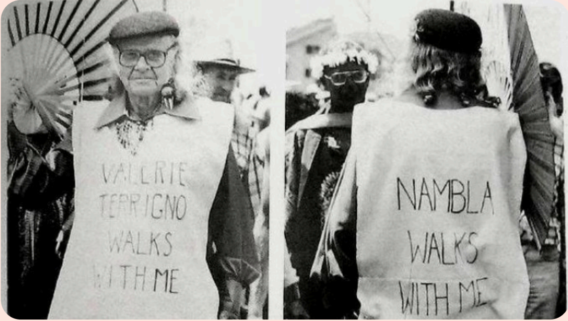
LGBT hareketinin öncülerinden olan Mattachine Society'nin kurucusu Harry Hay, aynı zamanda pedofili örgütü olan NAMBLA'nın aktivistlerindedir.

Eşcinsellik, pedofili ve hatta zoofiliyi bir "cinsel yönelim" olarak algılayan Kinsey'in raporları, eşcinselliğin normalleştirilmesi sürecinde sözde bilimsel kanıt olarak kullanılmıştır.