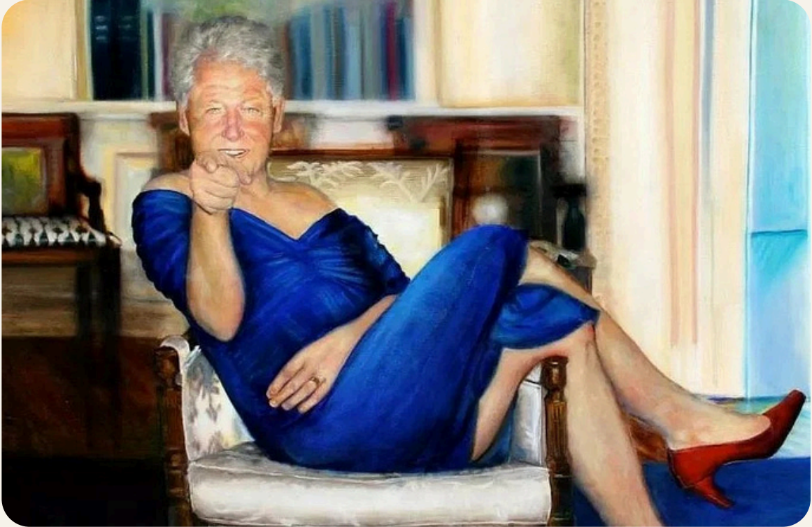
Jeffrey Epstein'in malikanesinde Bill Clinton'un mavi bir elbise ve kırmızı topuklu ayakkabı giydiđi bir yađlıboya tablosu bulunuyordu.

Son zamanlarda, onlarca kız çocuđuna cinsel istismarda bulunma ve çocuklar üzerinden bir fuhuş ađı oluřturma suçlamasıyla tutuklanan ve hapisyanede ölü bulunan Amerikalı milyarder Jeffrey Epstein'in dava dosyaları tekrar gündeme geldi. Tanınmıř, zengin ve nüfuzlu isimlerin de karıřtıđı bu davanın detayları yüzyılın en büyük pedofili ađını gözler önüne seriyor.