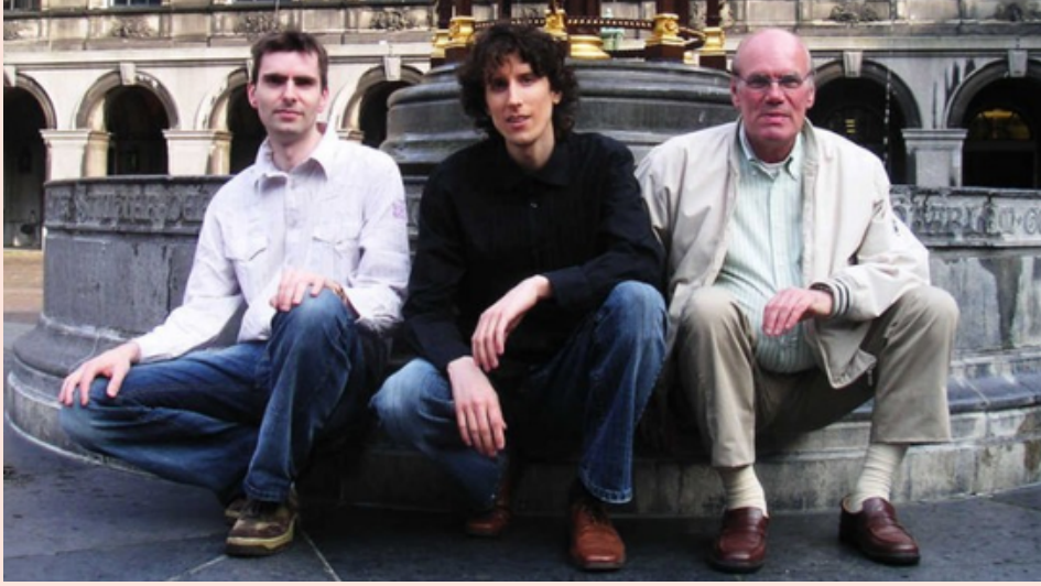
Pedofiliyi meşrulaştırmak üzere Hollanda'da kurulan PNVD partisinin kurucuları.

Dünya üzerinde pedofili aktivistlerinin en aktif olduğu yer ise Almanya'dır. 1970-80'li yıllarda doğrudan pedofili ile bağlantılı bir düzine dernek veya oluşumu bünyesinde barındırmış olan Almanya, geçmişten bugüne pedofili tartışmalarının da merkezi haline gelmiş bir ülkedir.